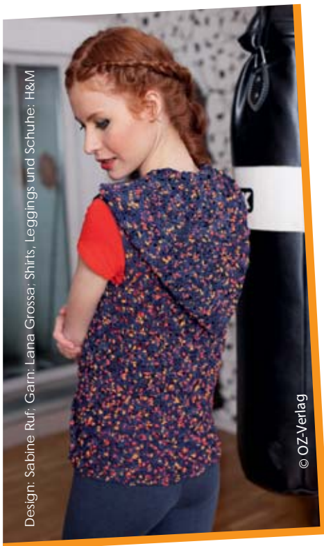
Design: Sabine Ruf; Garn: Lana Grossa; Shirts, Leggings und Schuhe: H&M